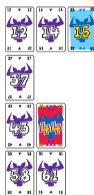
Ábra 2: sorok az első forduló után.

Példa: Ahogy azt az 1. ábra mutatja a kezdő lapok értékei a következők: 12,37,43,58. A négy játékos a következő lapokat játssza ki: 14,15,44,61. Az elsőként beilleszthető lap a 14, mert ez a legalacsonyabb értékű lap. A szabályban leírtak szerint a 14 értékű lap csak a 12 után illeszthető be, ezt követi a 15 értékű lap. A 44 értékű lap az első szabályban leírtak szerint az első és a második sorba is beilleszthető lenne, de a második a legkisebb különbség szabály miatt csak a harmadik sorba illeszthető. A 61 értékű lapot a második szabály meghatározása szerint a negyedik sorba lehet beilleszteni.